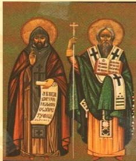
Св. Св. Кирил и Методий

Св. св. Кирил и Методий, известни още като Солунските братя, са създатели и разпространители на първата славянска азбука. Канонизирани като светци за превода и популяризирането на Библията на старославянски език.